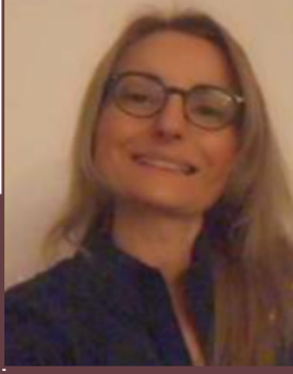
GÜİ SALDIRANER EG Partner- SMMM, BD www.eg-econsulting.com