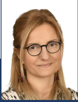
Güi SALDIRANER EG Partner- SMMM, BD www.eg-econsulting.com